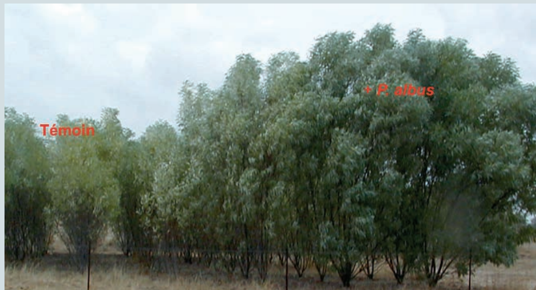
Photo 1. Effet de l'inoculation ectomycorhizienne sur la croissance de Acacia holosericea après deux années de plantation au Sénégal.

3 Université Lyon 1 Cnrs, Umr 5558 Laboratoire de biométrie et biologie évolutive 69622 Villeurbanne Cedex France